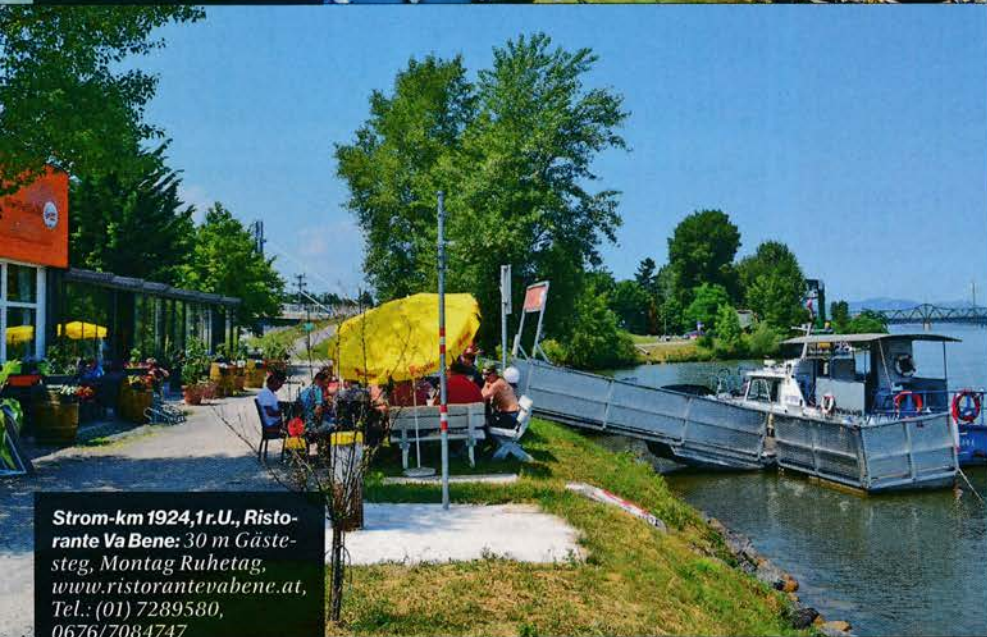
Strom-km 1924,1 r.U., Ristorante Va Bene: 30 m Gästesteg, Montag Ruhetag, www.ristorantevabene.at , Tel.: (01) 7289580, 0676/7084747